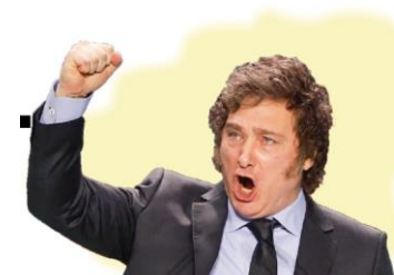
Imagen negativa + Regular negativa = 32%

Imagen positiva + Regular positiva = 68%