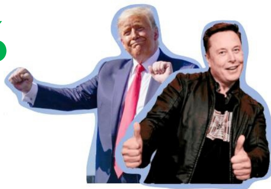
IMAGEN DE ELON MUSK

POSITIVA 39% REGULAR 19% NEGATIVA 35% NO SABE 7%