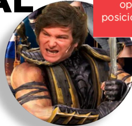
IMAGEN PERSONAL DE JAVIER MILEI

Estudio nacional de opinión pública y posicionamiento político